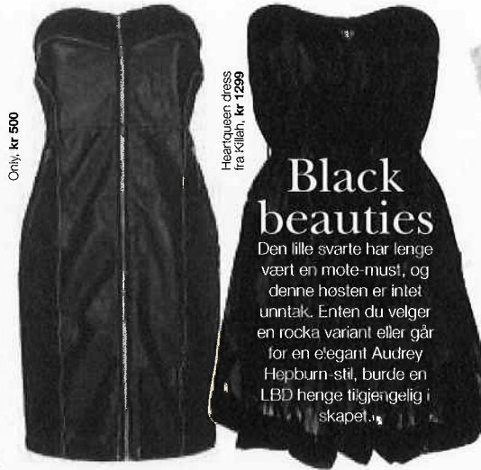
Heartquakeen dress fra Killaah, kr 1299