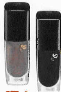
P/S, kr 195