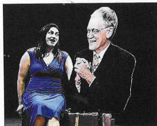
Shabana Rehman under øving på «New School of Drama Theater» før fredagens premie. Showet inkluderer et fiktivt intervju med David Letterman.