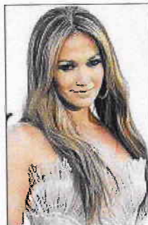
Jennifer Lopez skal ha krevd for mye i lønn – og er nå ikke aktuell som dommer i «American Idol».

Så langt er Randy Jackson og Kaira DioGuardi klar for den tiende sesongen. I Norge er det TV 2 Zebra som sender «American Idol». (NTB)