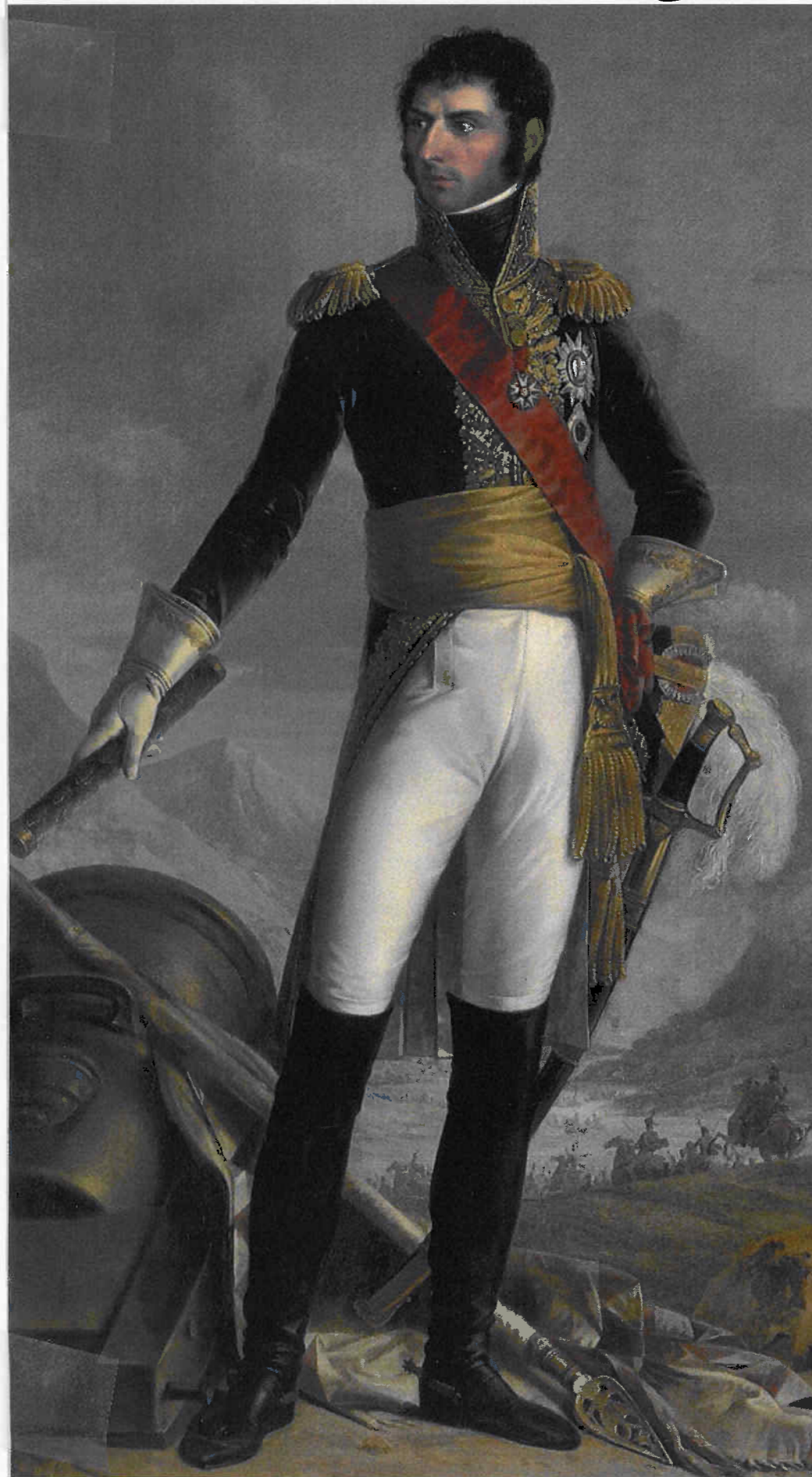
Jean Baptiste Bernadotte, marskalk av Frankrike, konge av Sverige, anno 1818.

Det kommer nok en ny bok om hans liv som konge i Norge og Sverige.